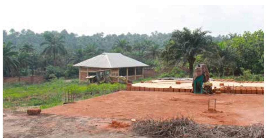
Der Bauplatz liegt auf einer Anhöhe inmitten der Dörfer von Umunumo.

tute in Onitsha. Es wird bereits mit Erfolg betrieben (s. Bild rechts und auf der Frontseite) und wurde von einer italienischen Hilfsorganisationen gebaut. Die wenigen staatlichen Berufsschulen in Nigeria kämpfen mit grossen Problemen und haben einen sehr niedrigen Standard.