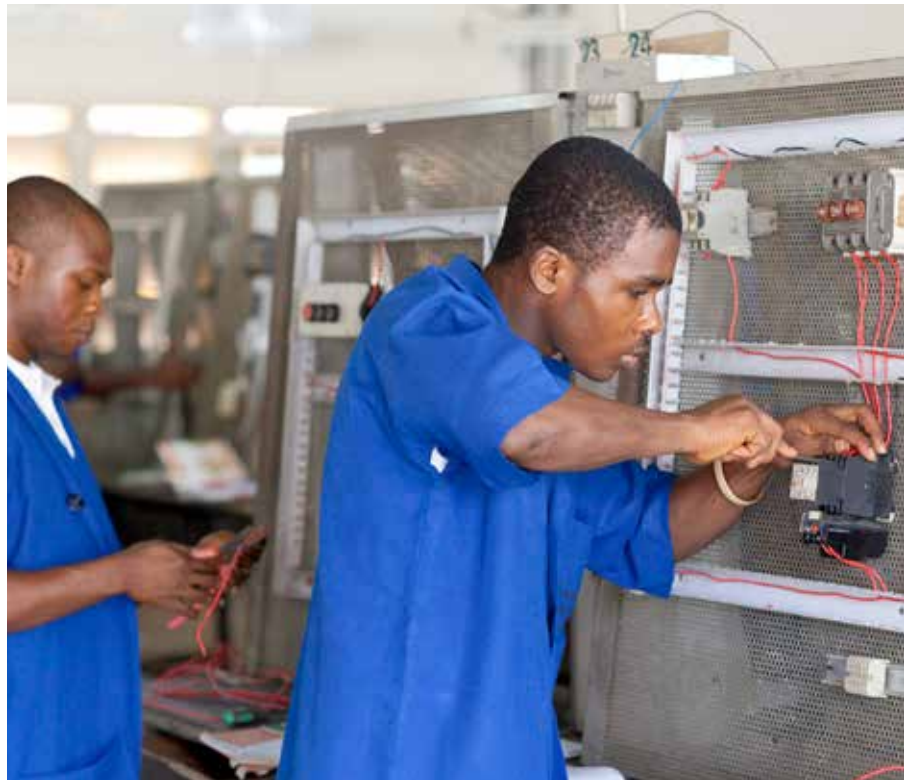
Das Don Bosco Technical Institute in Onitsha ist eine Vorzeigeschule und dient als Vorbild für die Mbara Ozioma Berufsschule in Umunumo.

Auch die Schule selbst wird ihren Beitrag zur Wirtschaftlichkeit des Betriebs leisten. Die fortgeschrittenen Lehrlinge werden kleine Produktionsaufträge in der Region ausführen können. Dass diese mit den Ausbildungsinhalten kompatibel sein müssen, versteht sich von selbst.