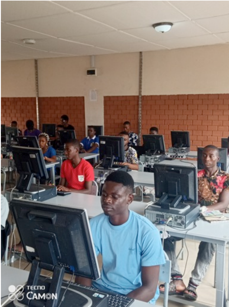
Computerausbildung und Maschinenpark an der MOCTECH

Bachmann-Stiftung und unsere Spender*innen halfen, die Lücke fast ganz zu schliessen. Wir danken herzlich dafür. Ebenso musste die Schule bis Mitte Oktober geschlossen werden und die Student*innen mussten von Zuhause aus ihre Ausbildung fortsetzen. Wie einschneidend diese Situation für sie und die Lehrpersonen war schilderten sie eindrücklich in unserem MO-Corona-Newsletter vom Mai. Schwierig war ebenfalls die finanzielle Sicherung der Schule, da die pandemiebedingt sinkenden Einkommen der Eltern die Schulgeldzahlungen minderten. Die Lehrpersonen blieben angestellt und betreuten die Studentenschaft mittels e-learning-Programmen, schriftlichen Arbeitsmaterialien und Hausbesuchen. Ihr Einverständnis mit Lohnreduktionen trug stark dazu bei, dass der Rechnungsabschluss der Schule 2020 nicht wesentlich vom Budget abwich und das Defizit